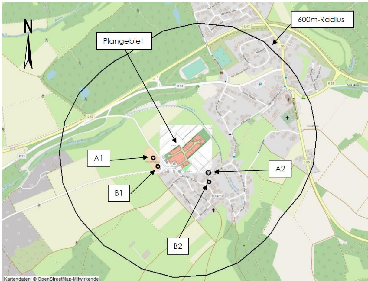
Abbildung 2: Kennzeichnung Plangebiet und Immitenten (A1, A2: Tierhaltungsbetriebe, B1, B2: Brennereien)

Durch das Ausbreitungsmodell (AUSTAL) wurden innerhalb des Geltungsbereiches des Plangebietes Geruchsstundenhäufigkeiten zwischen 2% und 14% als Gesamtbelastung 1G_b , hervorgerufen durch die Tierhaltungen Nr. A1 und Nr. A2 und die Brennereien Nr. B1 und Nr. B2 im genehmigten Bestand, ermittelt. Die belästigungsrelevanten Kenngrößen liegen somit teilweise oberhalb des Immissionswertes gemäß Anhang 7 [TA Luft 2021] für die Gebietsnutzung Wohn-/Mischgebiete (10 %). Da sich das Plangebiet im Übergang zum Außenbereich befindet, ist gemäß Anhang 7 [TA Luft 2021] die Festlegung von Zwischenwerten möglich. Allgemein sollten die Beurteilungsflächen den nächsthöheren Immissionswert für Dorfgebiete (15 %) nicht überschreiten.