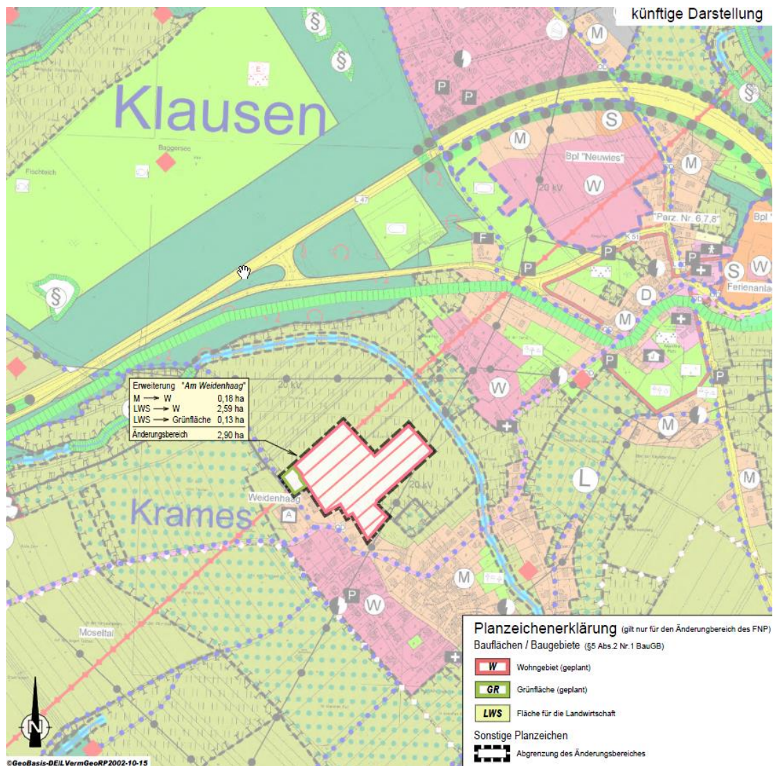
Abbildung 1: Flächennutzungsplan, Ortslagenausschnitt Klausen