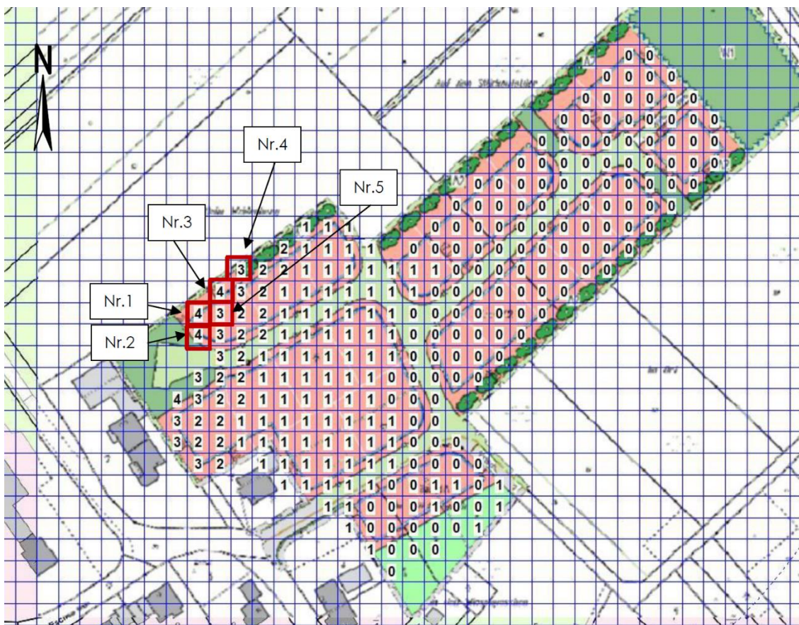
Abbildung 4: Vorbelastung durch Brennerein in % der Jahresstunden, Seitenlänge 8 m