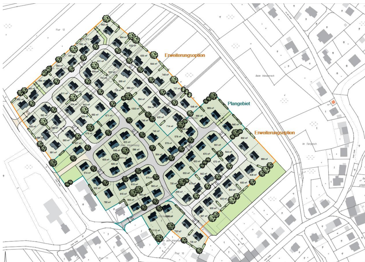
Abbildung 6: Parzellierungsplan mit Andeutung weiterer Bauabschnitte (blasse Darstellung mit oranger Abgrenzung)

Die innere Erschließung erfolgt durch Stichstraße, so dass eine zweiseitige Bebauung grundsätzlich gegeben ist. Richtung Nordwesten und Südosten zweigen Grünachsen ab, die die Möglichkeit offenhalten weitere bedarfsorientierte Bauabschnitte an das Straßennetz anzuschließen, sofern die Voraussetzungen (Flächenverfügbarkeit, Immissionsschutz) in Zukunft erfüllt werden sollten. Diese Freihalteachsen werden als öffentliche Grünflächen im Bebauungsplan dargestellt. Im Südosten sind die naturschutzfachlichen Voraussetzungen zu einer künftigen Bebauung dieses Streuobstbestands vorab zu untersuchen. Im Fall, dass sich nach Prüfung ergibt, dass die mit Streuobstbäumen bestandene Fläche südöstlich des Geltungsbereiches nicht als essentielles Nahrungshabitat für Fledermäuse dient und dort langfristig ein städtebaulicher Lückenschluss möglich ist (den naturschutzfachlichen Ausgleich vorausgesetzt), ist eine Erschließung nach Überplanung und Ausbau des Grünkorridors nicht von vornherein blockiert.