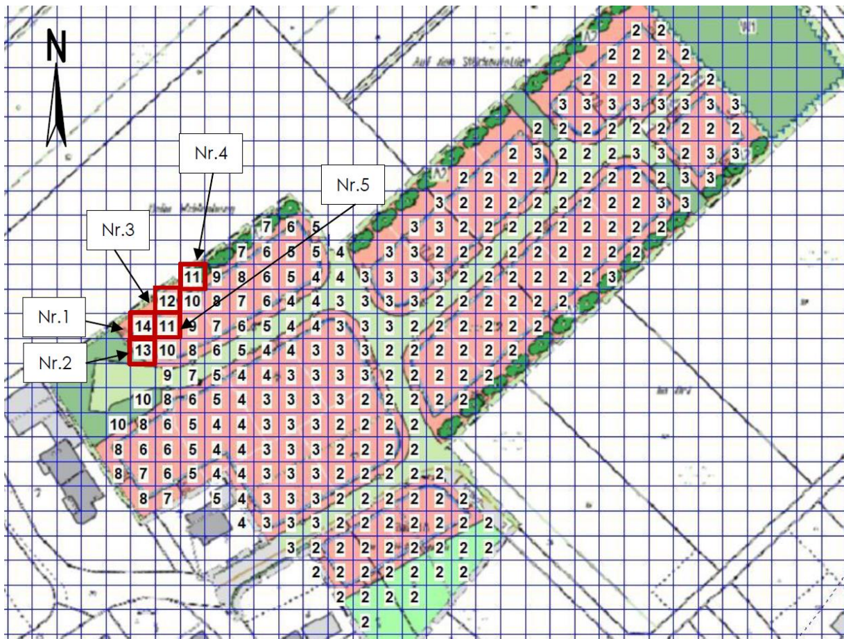
Abbildung 5: Gesamtbelastung durch Tierhaltungen und Brennereien in % der Jahresstunden, Seitenlänge 8 m

An den rot markierten Beurteilungsflächen (Nr. 1 bis Nr. 5) wurden Geruchsstundenhäufigkeiten zwischen 10% (Immissionswert für Wohn-/Mischgebiete) und 15 % (Immissionswert für Dorfgebiete) ermittelt (s. Abbildung 5).