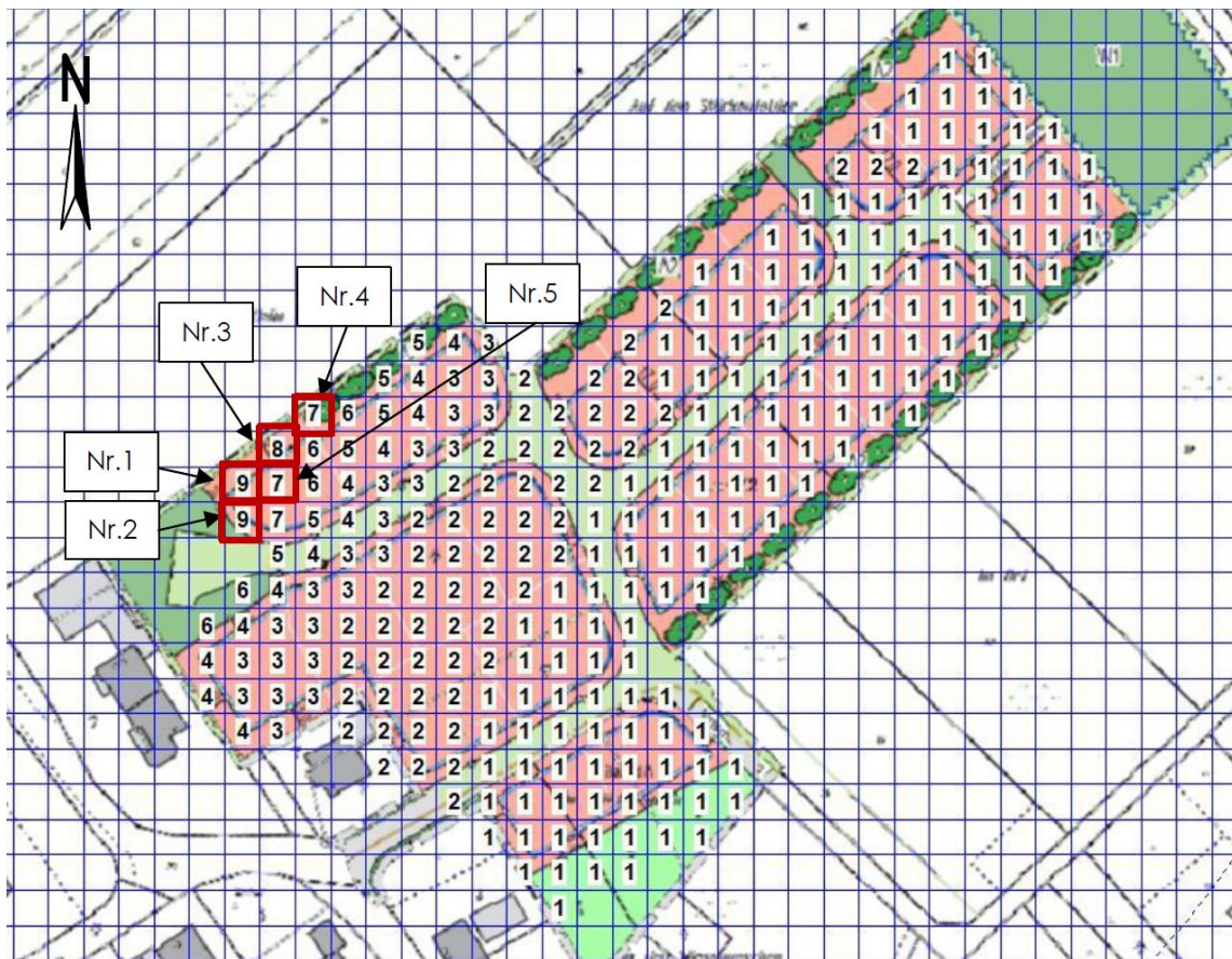
Abbildung 3: Vorbelastung durch Tierhaltungen in % der Jahresstunden, Seitenlänge 8 m